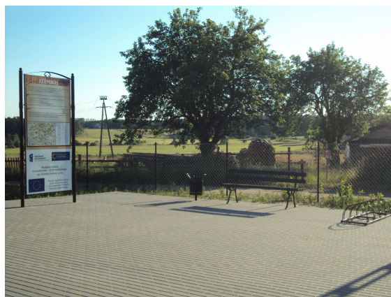
Stacja Kaszubskiego Ducha w Pobłociu