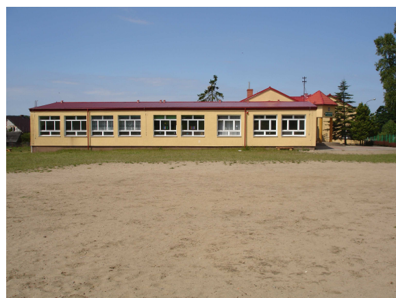
Budynek Szkoły Podstawowej w Pobłociu

W szkole Podstawowej uczy się 108 uczniów i jest zatrudnionych 16 nauczycieli. Miejszem sportu i rekreacji jest tu pełnowymiarowe boisko sportowe.