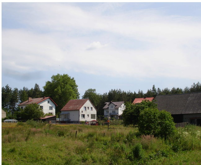
Tereny zurbanizowane – przeznaczone pod zabudowę