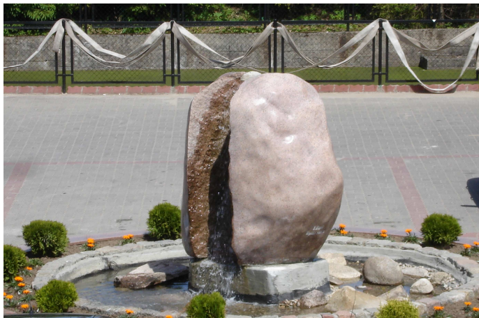
Fontanna na placu Ks. Bazylego Oleckiego