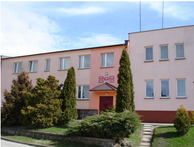
Urząd Gminy w Lini

Miejszem sportu i rekreacji jest boisko sportowe przy ul. Sportowej oraz kompleks boisk sportowych „ORLIK” położony przy ul. Szkolnej.