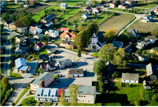
Panorama centrum Lini z lotu ptaka