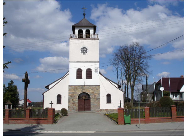
Kościół w Lini