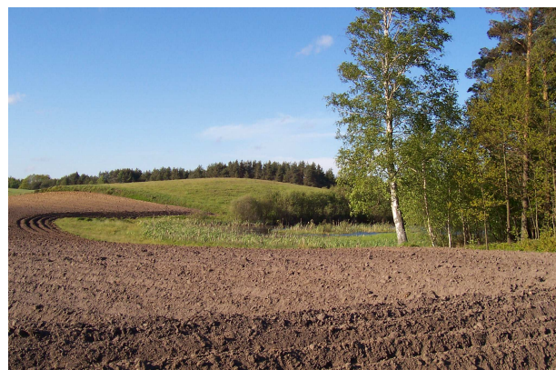
Tereny pod zabudowę mieszkaniową i letniskową w Lini