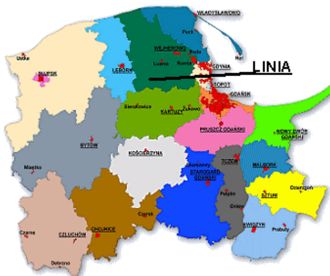
Mapa powiatów woj. pomorskiego.

Przez miejscowość przebiegają drogi powiatowe prowadzące do Wejherowa, Lęborka, Kartuz, Kościerzyny i Sierakowic. Ważne są także dogodne połączenia PKS z Wejherowem, Gdynią, Kartuzami i Lęborkiem