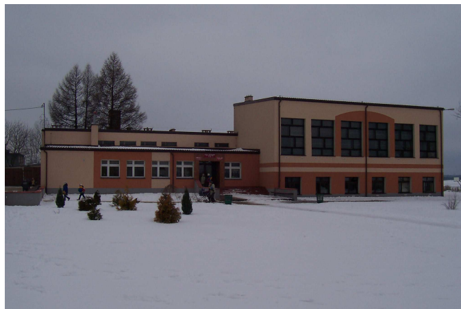
Zespół Szkół w Lini