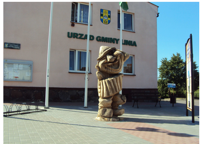
Stacja Kaszubskiego Ducha w Lini