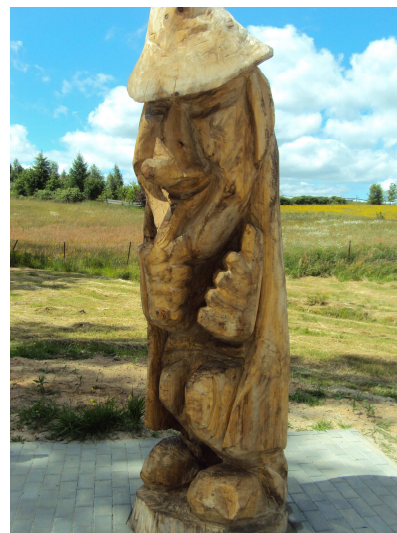
Stacja Kaszubskiego Ducha w Miłoszewie