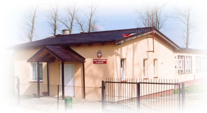
Szkoła Podstawowa w Miłoszewie

W Miłoszewie znajduje się Szkoła Podstawowa, w której uczy się 38 uczniów (stan na 29.02.2012 r.) i jest zatrudnionych 11 nauczycieli. W szkole dzieci uczą się języka kaszubskiego.