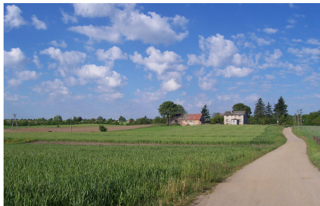
Widok od strony kaplicy