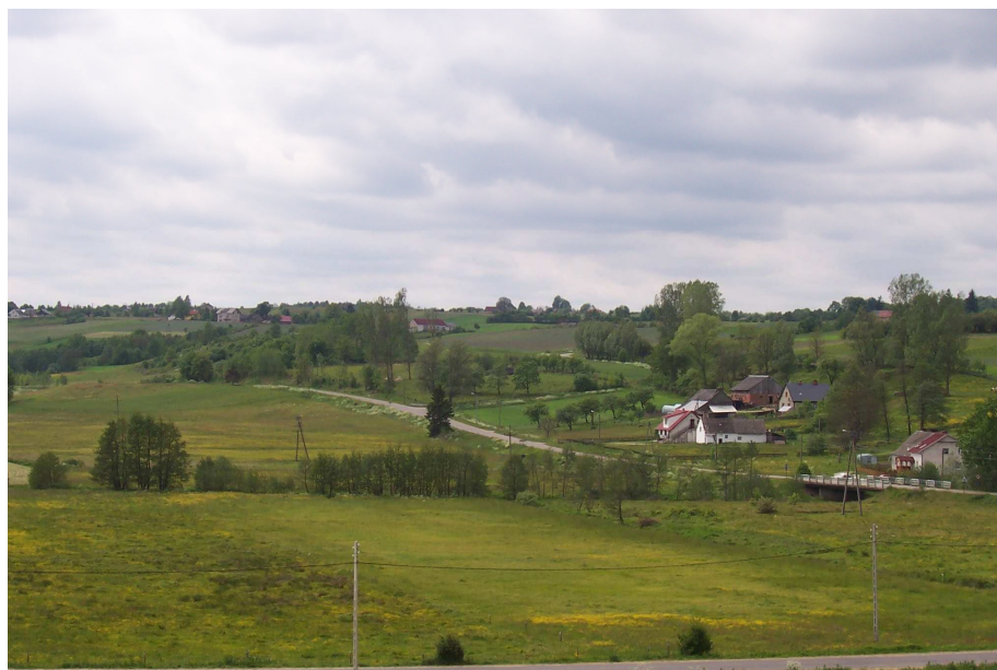
Z lewej strony początek panoramy Doliny rzeki Łeby w Miłoszewie

w połączeniu z dobrze zachowanym tradycyjnym budownictwem stwarzają wyjątkowo cenne walory krajobrazowe. Część Miłoszewa położona jest na terenie Krajobrazowego Parku Kaszubskiego i jego otuliny. Jest to obszar o bardzo urozmaiconej rzeźbie terenu, o dużych walorach przyrodniczych, kulturowych i rekreacyjnych. Miejscowość położona jest na terenie obszarów NATURA 2000. W ramach programu wyznaczone zostają tzw. Obszary Specjalnej Ochrony Ptaków (Special Protection Areas – SPA) oraz Specjalne Obszary Ochrony Siedlisk (Special Areas of Conservation – SAC), na których obowiązują ochronne regulacje prawne.