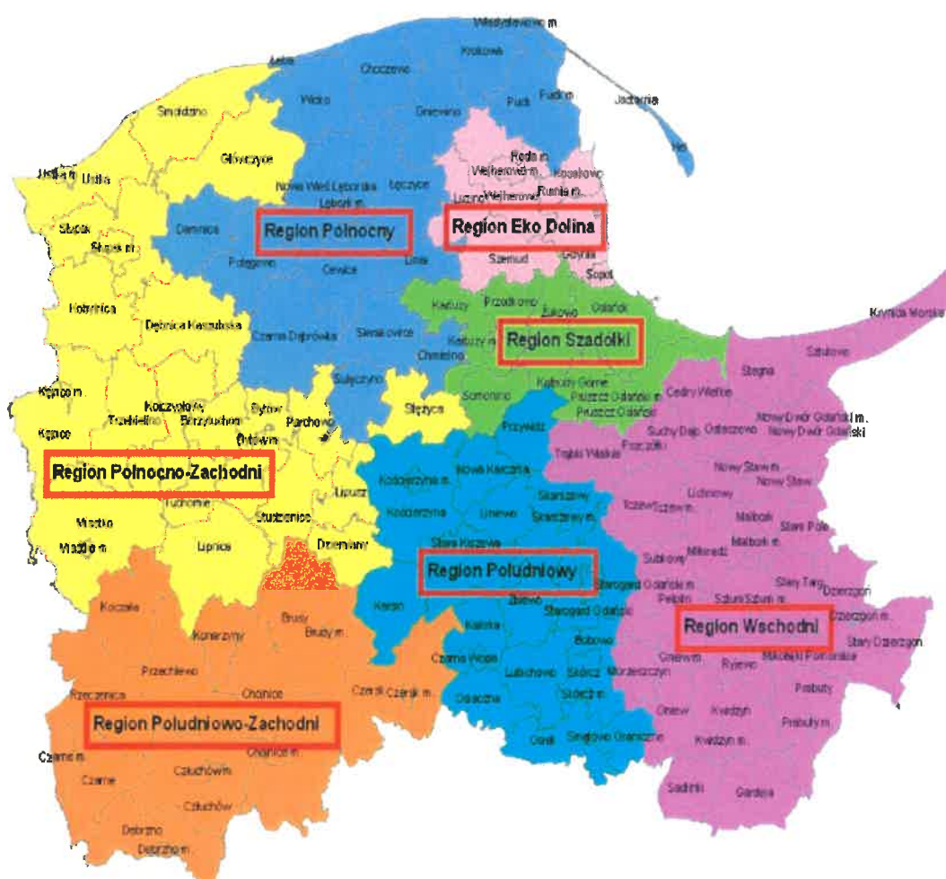
Podział województwa pomorskiego na rejony gospodarki odpadami

Sejmik Województwa Pomorskiego uchwałą Nr 415/XX/12 z dnia 25 czerwca 2012 roku przyjął Plan Gospodarki Odpadami dla Województwa Pomorskiego 2018 . W dokumencie tym dokonano podziału województwa pomorskiego na 7 regionów gospodarki odpadami komunalnymi, których położenie prezentuje poniższa mapa.