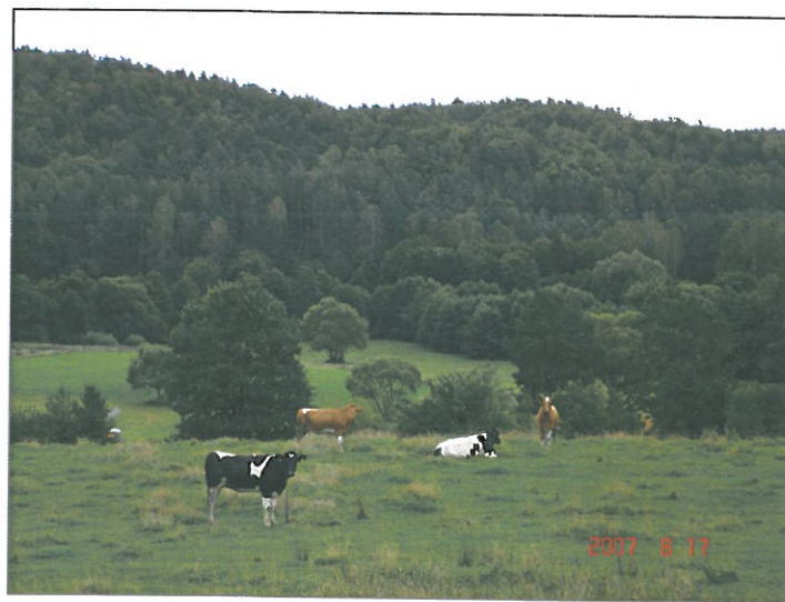
Dolina Łeby w Osieku