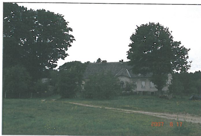
Dwór w Osieku