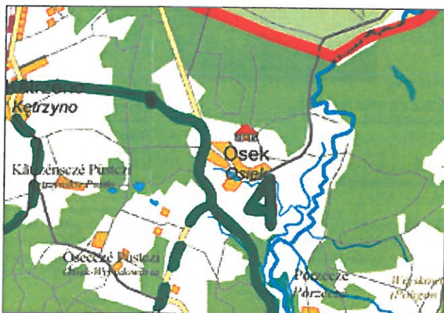
Szlak turystyczno – przyrodniczego „Poczuj kaszubskiego ducha” w miejscowości Osiek

Przebudowana zostanie również przy wsparciu Powiatu Wejherowskiego droga nr 1420 G Godętowo – Nawcz – Tłuczewo – odcinek Nawcz – Osiek, co przyczyni się do promowania szlaku turystyczno – przyrodniczego „Poczuj kaszubskiego ducha”. Wytyczona trasa rowerowa i piesza umożliwiła lepszy dostęp do obiektów turystyczno – rekreacyjnych zarówno dla mieszkańców jak i turystów, z których jeden został usytuowany w centrum miejscowości Osiek. We wsi stoi Jablón – demon mieszkający w sadach i opiekujący się drzewami, krzewami owocowymi oraz ogrodami.