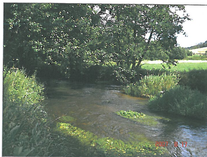
Rzeka Łeba w okolicach Osieka