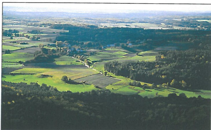
Panorama Osieka z lotu ptaka