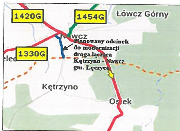
Planowana do modernizacji droga gruntowa nr 125013G.

Wyremontowane drogi pozwolą mieszkańcom wsi Osiek, ale również całej gminie Linię i Łęczyce swobodny dostęp do miejscowości Nawcz, z której będzie można dotrzeć do drogi krajowej nr A6 łączącej ze sobą miasta Wejherowo i Lębork oraz do najbliższej stacji SKM,