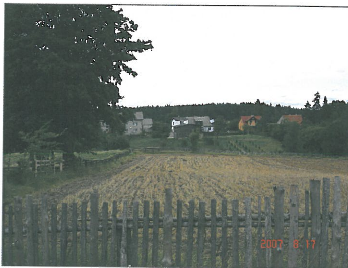
Tereny pod zabudowę mieszkaniową i letniskową w Osieku

Nie ma zorganizowanych miejsc sportu i rekreacji.