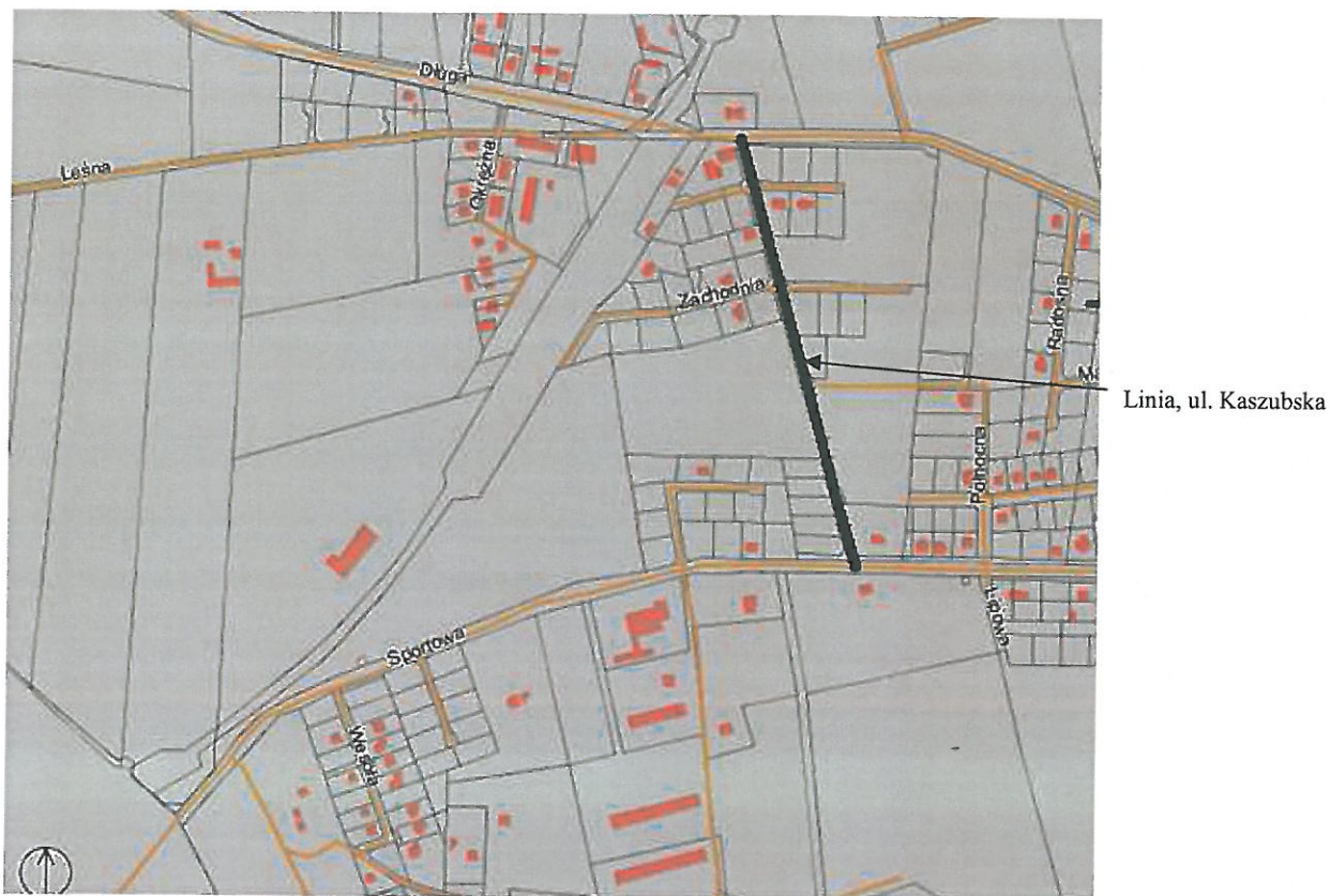
Rys.1 Mapa poglądowa z zaznaczoną na czarno drogą przeznaczoną do zaliczenia do kategorii dróg gminnych (Linia, ul. Kaszubska)