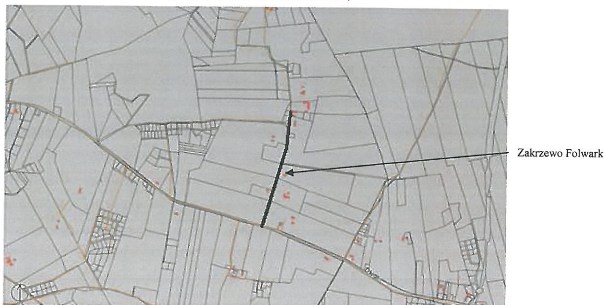
Rys.2 Mapa poglądowa z zaznaczoną na czarno drogą przeznaczoną do zaliczenia do kategorii dróg gminnych (Zakrzewo Folwark)