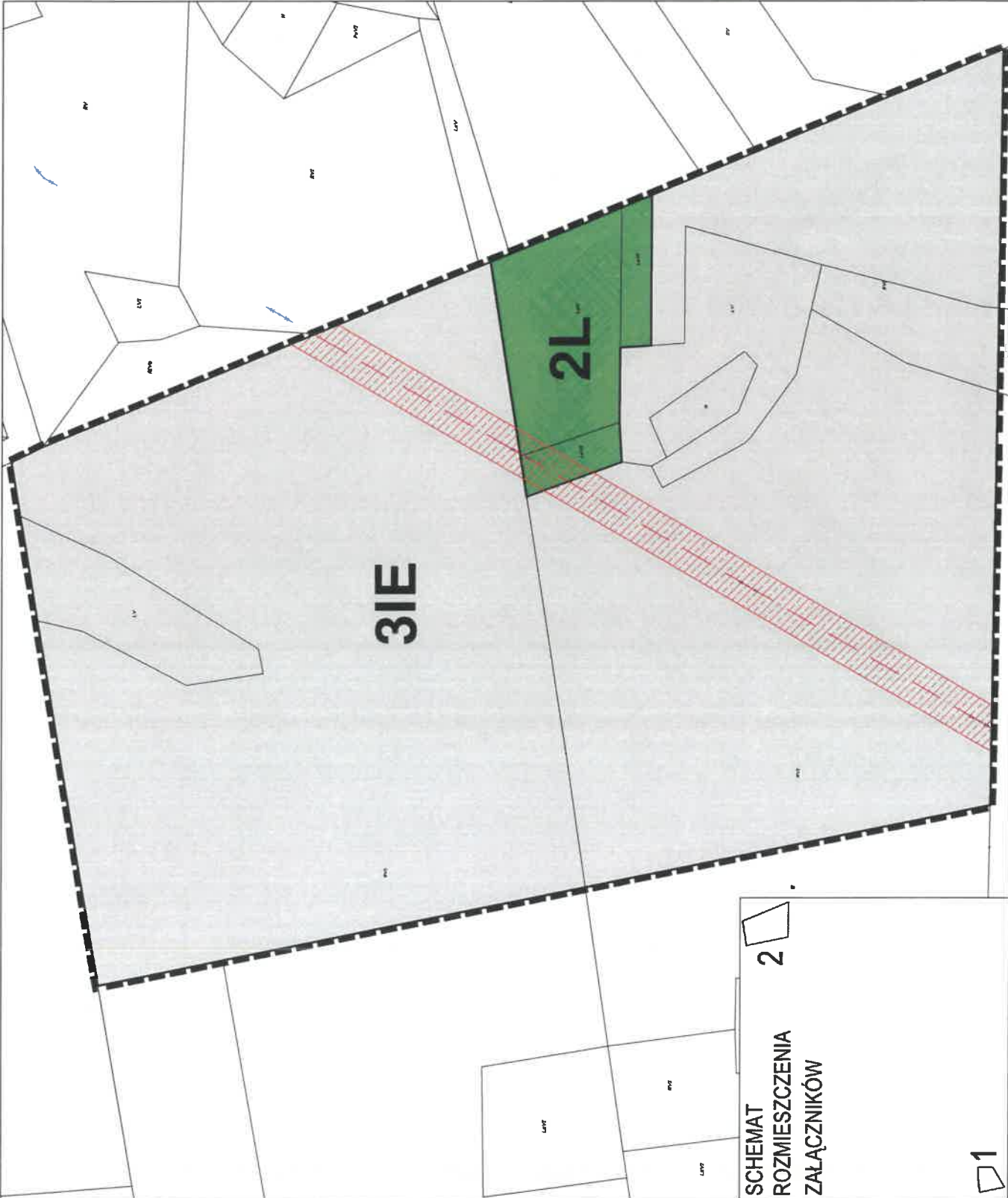
SCHEMAT ROZMIESZCZENIA ZAŁĄCZNIKÓW